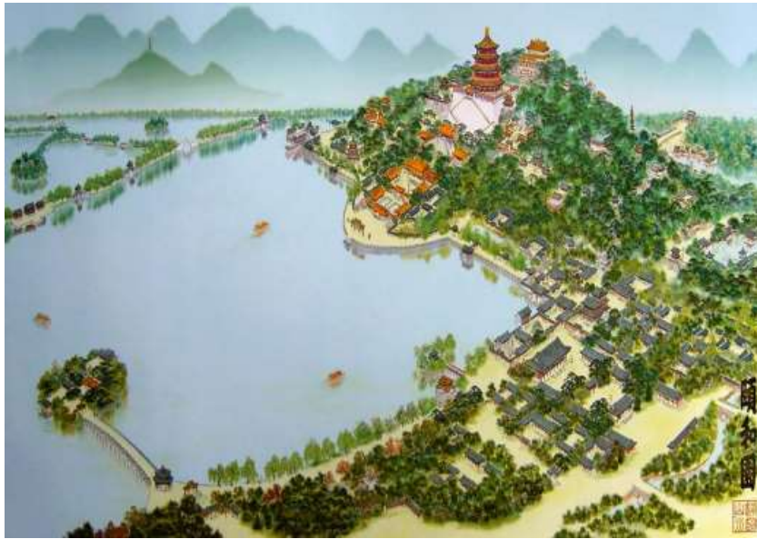
Şekil 1. Yi He Yuan (Yaz Sarayı Parkı)'nın üç boyut görünüşü (Anonim 2008e)

İngilizce adı Summer Palace olan Hi He Yuan (Yaz Sarayı Parkı) UNESCO tarafından 1987 yılında en büyük alana sahip kültür mirası olarak belirlenmiştir ve 2000 yılında ISO9000 kalite belgesinden geçmiştir. 1998 yılında “dünya mirasları listesinde” yer almıştır (Xu Lin 2006) (Şekil1).